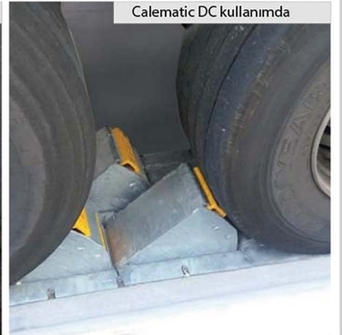
Calematic DC kullanımında