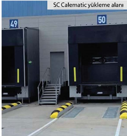
SC Calematic yükleme alanı